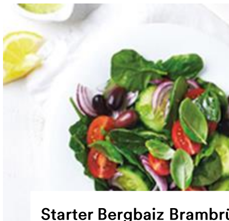
Starter Bergbaiz Brambrüesch