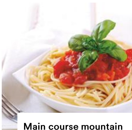
Main course mountain restaurant Pradaschier

Capuns Sursilvans with meat in a creamy cheese sauce