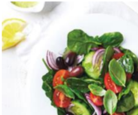
Vorspeise Bergbaiz Brambrüesch

Bündner Gerstensuppe oder Gemischter Salat mit Hausdressing