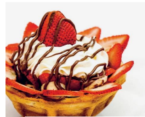
Dessert Café Restaurant Portal Churwalden

Röteli Parfait oder Kinder-Dessert Eis-Stängel und 1 Tasse Kaffee, Cappuccino, Latte Macchiato, Tee oder 3dl Softgetränk nach Wahl