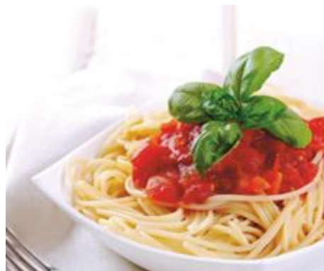
Hauptgang Bergrestaurant Pradaschier

Capuns Sursilvans mit Landjäger, Salsiz und Bündnerfleisch an einer Bergkäse-Rahmsauce oder Vegetarische Capuns mit saisonaem Gemüse an einer Bergkäse-Rahmsauce