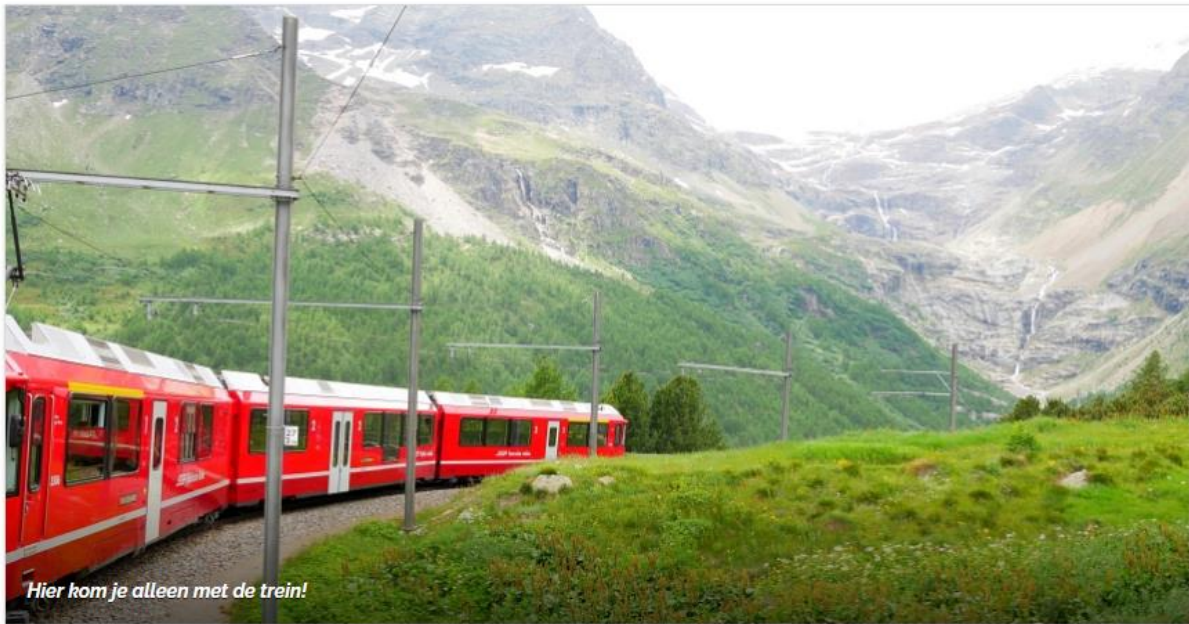
Hier kom je alleen met de trein!