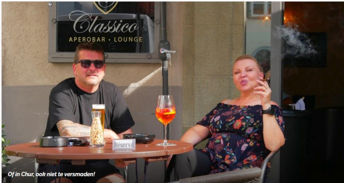
Of in Chur, ook niet te versmaden!

Er zijn in Zwitserland bijzonder veel bijzondere trajecten. Samen vormen ze de Grand Train Tour of Switzerland . Met namen als: de Glacier Express, de GoldenPass en dus ook 'mijn lijn', de Bernina Express. Het is smalspoor, deels tandrad, met panoramarijtuigen en ramen die open kunnen voor het maken van foto's. Als alternatief kun je trouwens gerust ook de regionale treinen nemen: zelfde route, zelfde slow-travel, zelfde uitzichten, maar wel een heel stuk goedkoper. Dus zeker het overwegen waard.