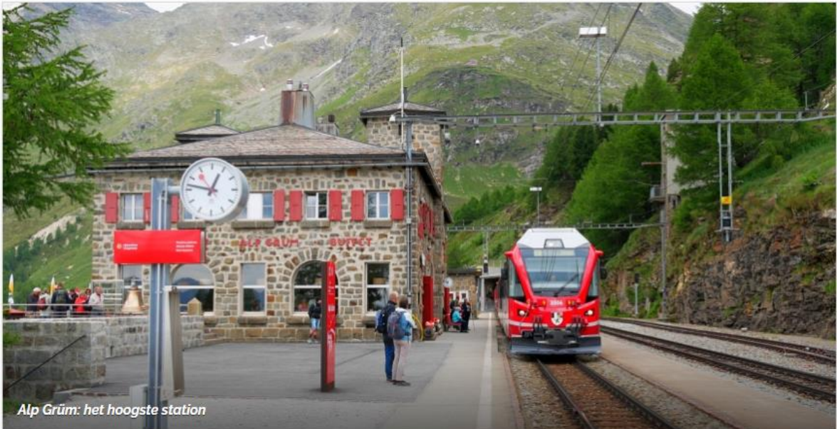
Alp Grüm: het hoogste station