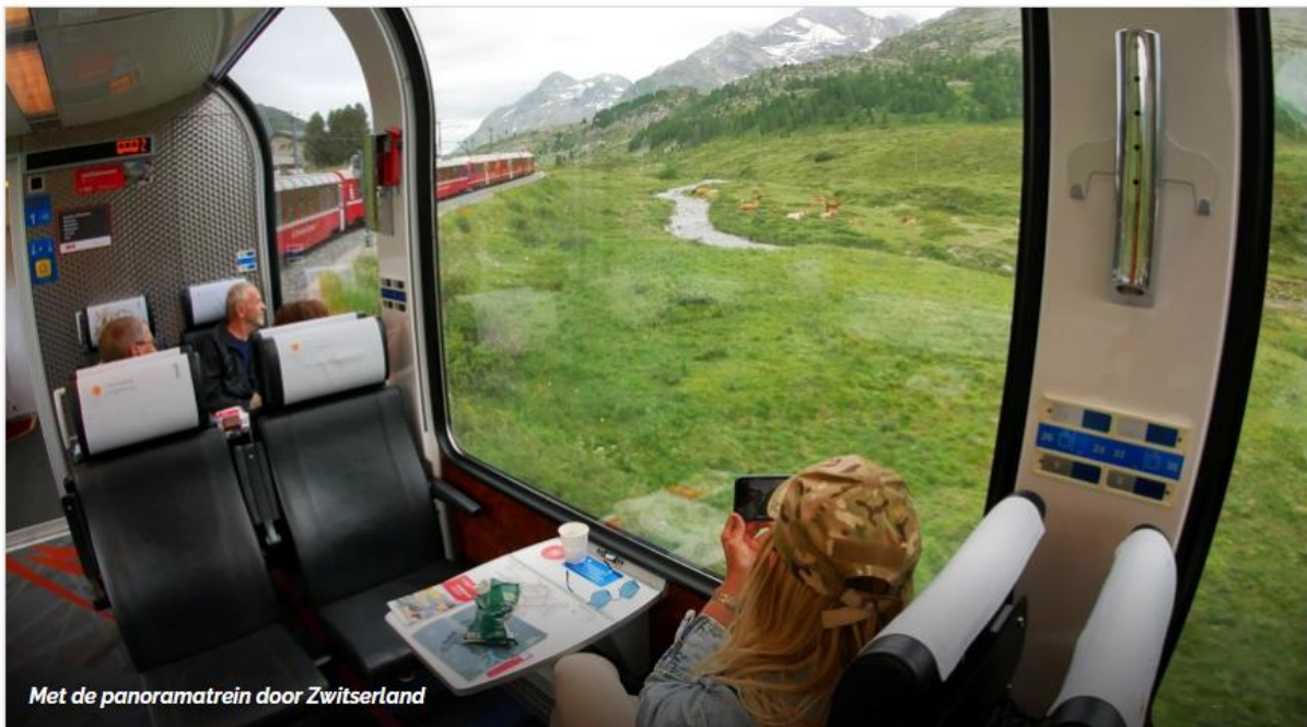
Met de panoramatrein door Zwitserland

Er zijn in Zwitserland bijzonder veel bijzondere trajecten. Samen vormen ze de Grand Train Tour of Switzerland . Met namen als: de Glacier Express, de GoldenPass en dus ook 'mijn lijn', de Bernina Express. Het is smalspoor, deels tandrad, met panoramarijtuigen en ramen die open kunnen voor het maken van foto's. Als alternatief kun je trouwens gerust ook de regionale treinen nemen: zelfde route, zelfde slow-travel, zelfde uitzichten, maar wel een heel stuk goedkoper. Dus zeker het overwegen waard.