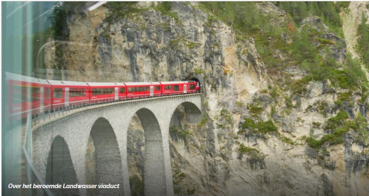
Over het beroemde Landwasser viaduct

"De Bernina Express is onderdeel van de Rhätische Bahn : het spoornet van Graubünden, dat werd aangelegd in 1888 door een Nederlander," vertelt mijn gids in Chur me een paar dagen later. "Zijn vrouw wilde op een makkelijk manier naar Davos kunnen reizen, om te kuren." Nou, het resultaat mag er zijn! De rode wagons, de viaducten, de panorama's, de bergen en de snelstromende bergbeken: het lijkt wel een modelspoorbaan. Maar dan in het écht! En ik reis mee.