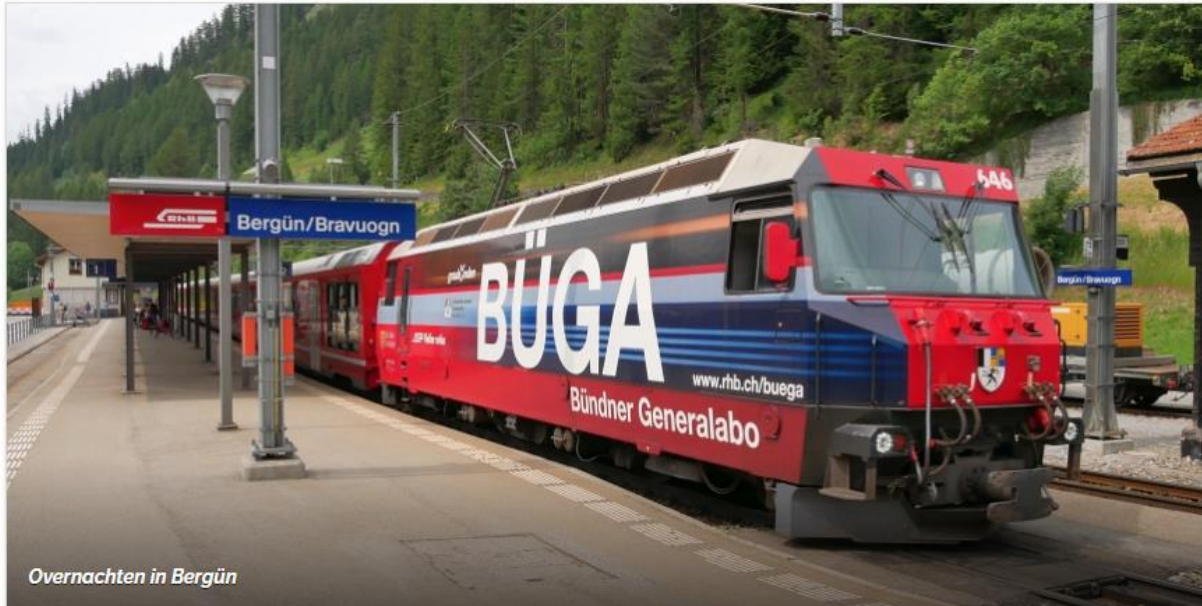
Overnachten in Bergün

"Eet je vanavond mee?", vraagt het meisje van dienst me in hotel Garni Albula in Bergün . Ik reis in kleine etappes en ik onderbreek mijn reis dus regelmatig. Zoals vandaag in dit fraaie bergdorp. Hotel Garni Albula trakteert me op een heerlijke Saltimbocca met risotto: want Zwitserland is meer dan racletten en kaasfondue wil men maar zeggen. Veel meer. En dat klopt.